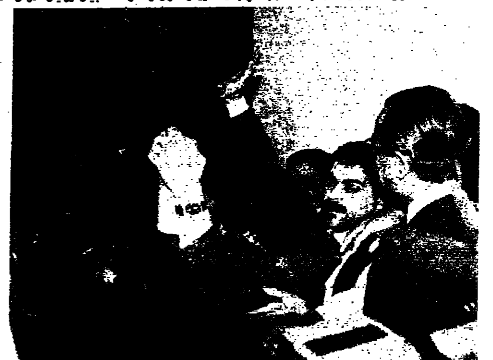
الرئيس الجميل يجيب المستعربين